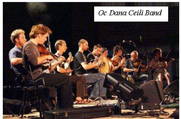
Oc Dana Ceili Band