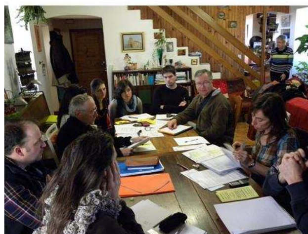
Le nouveau CA réuni à Arcambal

Il est lancé un appel aux bonnes volontés pour donner un coup de main à l'évolution du site.