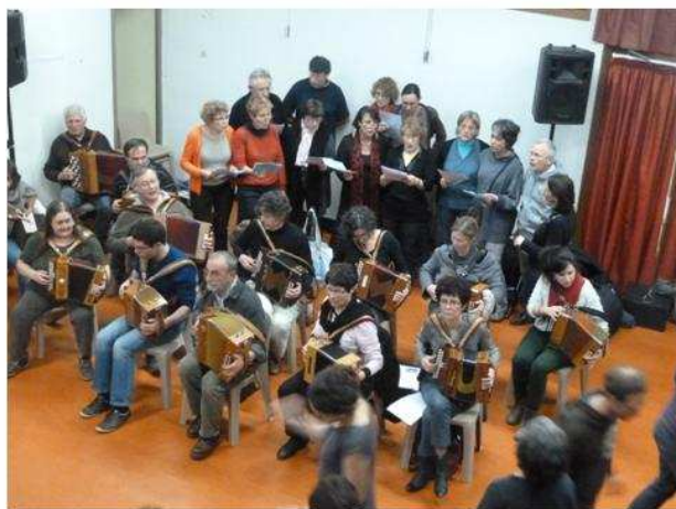
Les stagiaires en début de bal

Le C A étant démissionnaire, il demande l'accord de l'assemblée pour se représenter et en profite pour demander un peu de sang neuf : Nous avons le plaisir d'accueillir deux jeunes filles qui veulent bien se rapprocher de nous et commencer à travailler au sein de l'AMTPQ.